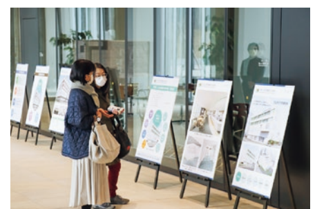
同時開催のパネル展の様子