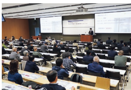
第1部シンポジウムの様子

各構成法人の建物の完成予想図や機関の概要を紹介するパネル展も本学新札幌キャンパスとサンピアザ光の広場にて同時に開催し、厚別区の方を中心に多くの皆さまにご来場いただき、盛況のうちに終了しました。