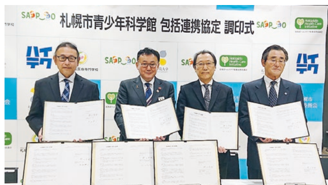
左から河西学長、檜田教育長、徳田ヘルスケア産業振興協議会会長、正垣滋慶学園常任理事