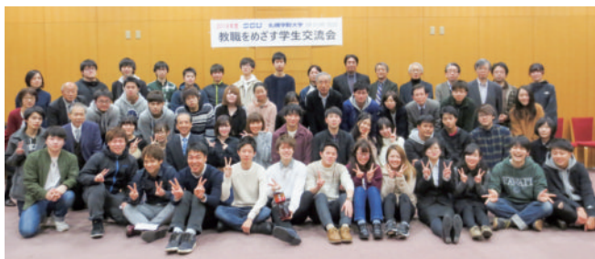
教職をめざす学生交流会（2018年11月22日）

2019年度採用の教員採用試験には、北海道、札幌市、山形県に、現役4年生から小学校6名、高校商業2名、特別支援学校4名の計12名、既卒者31名（小学校、社会、英語、商業、特別支援学校等）の合計43名（2019年1月7日時点確認分）が登録されました。2018年11月22日には、合格者の努力を労い、経験を教職課程全体のものにするために、G館8階を会場に、「教職をめざす学生交流会」が開催され、後輩たちも教員への決意を新たにしました。