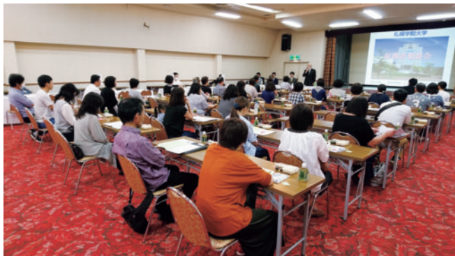
昨年の地方会場における説明会の様子

※本学会場では、13時よりキャリア支援課主催の「保護者向け就職活動勉強会」を開催します。