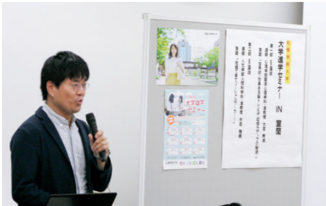
大学進学セミナー室蘭会場の様子

遠方のためオープンキャンパスへのご参加が難しい高校生、保護者、教員の皆さまのお越しをお待ちしております。