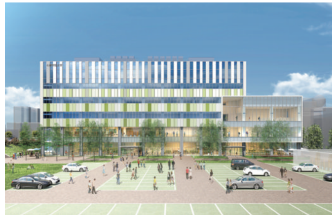
■キャンパスイメージ図 (変更となる場合があります)

「多様なこと・ひと・もの (diversity)」との「協働 (collaboration)」をキャンパスコンセプトとする新キャンパスの工事がいよいよ10月から始まります。交通の要所である新札幌に開設される「都市型・開放型」のキャンパスには、在学生・教職員のみならず卒業生、保護者、地域住民、企業、自治体の皆様との協働を容易にする様々な施設が整備されます。本学が外部の諸機関、住民と連携し、教育の質を高める一方、本学の教育研究資源を社会へ還元するオープン・エデュケーションを実践する産学連携センター、図書館、多目的ホール、心理臨床センターを備えた新キャンパスの開設は2021年4月を予定しています。また大規模な再開発プロジェクトが進む新札幌エリアでは2022年にもホテルや大型商業施設が開設予定です。旬なまちShin-Sapporoにますます注目です。