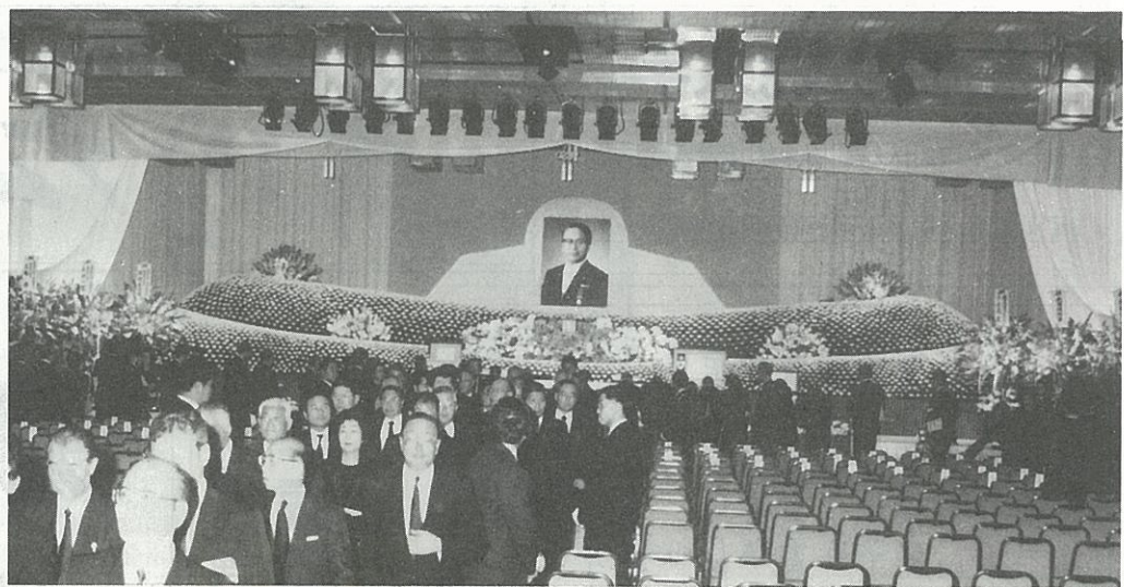
祭壇に献花をする参列者