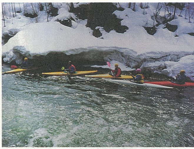
全国大会出場に向け、練習にも熱がこもる

カヌーとは言うまでもなく、カヌーという一人乗り競技用カヌーでスラローム競技の技術向上をめざした活動の二つに大きく分かれている。当面