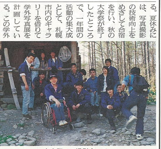
富良野での撮影会にて

から外国語の勉強を怠った報いか。余談だが青司会北方領土委員会(略称)の有志が、管轄法務局に北方領土の登記を申請し却下処分を受けた。今後の成行に注目したい。(興味のある方は同委員会にご一報を)