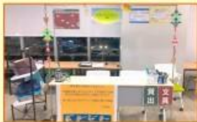
↑新札幌のコラボカウンター (クリスマス時期)

2022年度10月から、 コラボレーションセンターが 新札幌キャンパスに開設 しました。図書館内が活動 拠点です。図書館の入り 口から見て左側にコラボ カウンターがありますよ！