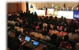
大学行事でのパソコンテイク

本学の障がいのある学生への支援内容などについては、以下の Web サイトをご覧ください。