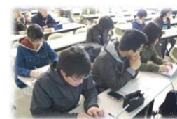
授業でのパソコンテイク

本学の障がい学生支援の始まりは学生達が自主的に立ち上げたバリアフリー委員会でした。その後、教職員組織としてのアクセシビリティ推進委員会が設置され、現在に至っています。学生同士の相互扶助、成長の気風は受け継がれ、障がいのある学生への情報保障、通学介助などの必要な支援等に直接かかわっているのは、多くの在学生たちです。テイク技術を学ぶための講習会、介助の講習会、手話の勉強会なども行います。初めての方でも技術を身につける機会がたくさんあります。支援活動を行うと、大学で定める謝金が支給されます。サポートセンターでは、支援学生を随時募集しています。