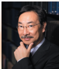
奈良大学文学部教授 千田 嘉博

せんだ よしひろ ● 愛知県生まれ。中学1年生から中・近世の城跡探検をはじめ。1982年名古屋大学教育学部附属高等学校卒業、1986年奈良大学文学部文化財学専攻卒業、名古屋市長教育委員会名古屋見晴台考古資料館学芸員、1990年国立歴史民俗博物館考古学部助手、1995年文部省在外研究員としてドイツ考古学研究所、イギリス・ヨーク大学に留学。2000年「織豊系城郭の形成」の研究により大阪大学文学博士。2001年国立歴史民俗博物館考古学部助教授、2005年奈良大学文学部文化財学専攻准教授、2009年教授。2012年8月-2013年8月ドイツ・エバーハルト・カール大学テュービンゲン・先史・古代・中世考古学研究所および、ドイツ・ヨハン・ヴォルフガング・ゲーテ大学フランクフルト・アム・マインの客員教授を勤める。2014年奈良大学学長。2015年濱田青陵賞受賞。