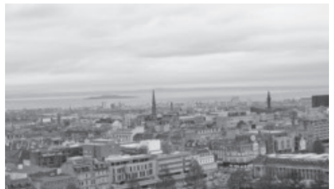
エディンバラ城からの風景

(3) スコットランドの国旗は青地に 白い斜め十字 の聖アンドリュースの十字架である。聖アンドリュースは、12使徒の一人で、ペテロと兄弟である。スコットランドは、イングランドあるいはアイルランドとの違いを示すために、12世紀にアンドリュース(イングランド聖人ジョージ、アイルランドの聖人パトリックス)を聖人とし、 スコットランドの独自性 を打ち出した。