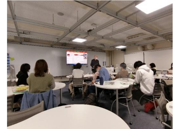
※実施イメージ：検討会