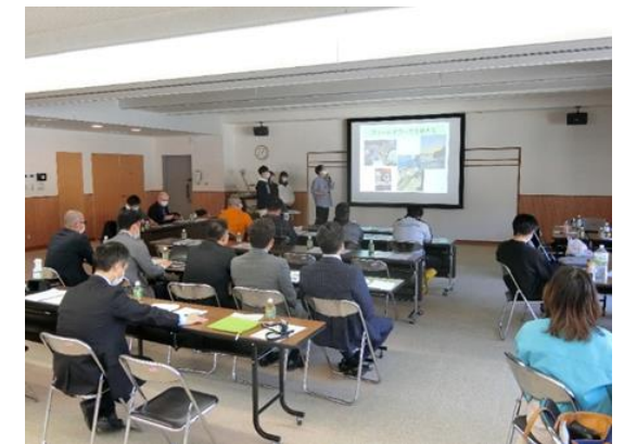
※実施イメージ：報告会