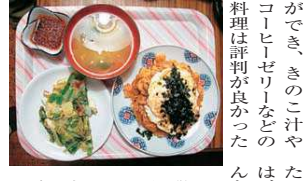
当日は準備の手際がよく時間に余裕ができて、きのこ汁やコーヒゼリーなどの料理は評判が良かった。