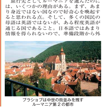
ブラショフは中世の街並みを残すルーマニア第2の都市

生徒が学生になるためには、ものごとを主体的に学ぶ姿勢を身につけることが必要だ。今回の「ルーマニア貧乏旅行」は、学生に主体的に学ぶ姿勢を身につけてもらうために企画したものである。 旅行会社が企画したガイド付きの東欧ツアーでは、自分自身で何も調べなくともそれなりに楽しい旅行が味わえる。しかし、主体的な学習姿勢を身につけることは期待できない。 今回企画した「ルーマニア貧乏旅行」では、学生が教養セミナーの時間に経路や訪問地を調査し企画を立案することを通して、旅行会社が企画するツアーの半額程度(15から20万円)でルーマニア旅行を行うことを目指した。この方法なら、安く海外旅行を行ったうえで主体的な学習姿勢も身につけることができる。 旅行先としてルーマニアを選んだのには、いくつかの理由がある。まず、あまり身近ではない国なので好奇心を喚起すると思われる点。そして、多くの国民の母語は英語ではないが、ある程度英語が通じる国であること。日本語ではあまり情報を得られないので、準備段階から外