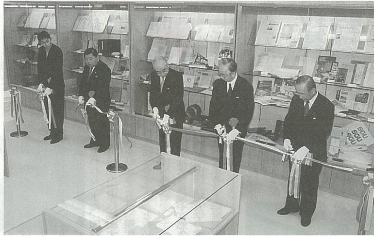
資料展示室の開館を祝い、テープカットをする関係者

写真Ⅱが四年有余の歳月を経てこのほど刊行された。『50年史』は、戦後開設された札幌文科専門学院以来の教育・研究活動をはじめとする本学の歴史の流れとその足跡が貴重な資料を基にして丹念に描かれている。編纂は五人からなる編集委員会が、教職員・学生・同窓生はもとより、父母・一般市民にも分かりやすく読んでもらえるような年史とすることを、また札幌文科専門学院・札幌短期大学・札幌商科大学・札幌学院大学まで半世紀の歴史を遡る年史として、可能な限り裏付け資料に当たり、本学の歴史の基礎となる、信頼に値する年史づくりをめざすことを基本に執筆に当たった。