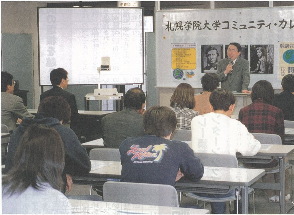
社会人向けにバラエティ豊かな、熱のこもった講座が展開されている

札幌学院大学はさる五月二十七日、札幌圏の地域社会に開かれた大学をめざし、札幌都心部(札幌市中央区北一条西八丁目、STV北一条ビル別館六階内)に「アクティブセンター」を開設いたしました。このセンターは、受験生の減少にともなう大学の経営環境の悪化などの厳しい情勢のもとで、本学が単に江別市の