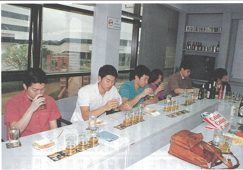
アマリットビール工場で味覚調査に協力する学生たち