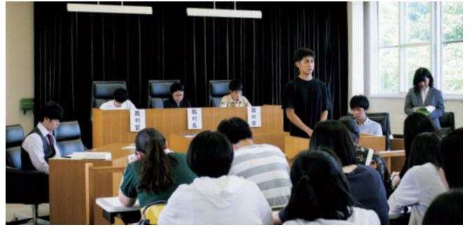
法廷教室での模擬裁判の様子

2021年には、法学部が満35歳を過ぎたことを記念する企画も予定されています。感染禍の収束をみて、お知らせする予定です。